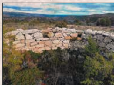
Collado Alto. Aliaga

La parte sur de la comarca, que seguía en poder de los republicanos, sucumbió en la Ofensiva de Levante, otra gran operación del ejército nacional que tenía como objetivo avanzar hacia el Maestrazgo y tomar la ciudad de Valencia. La ofensiva comenzó el 23 de abril y en dos días, con la ocupación del sector de Aliaga, finalizaba la Guerra Civil en todas las poblaciones de la comarca, un territorio que había estado en primera línea de combate desde los inicios mismos del conflicto.