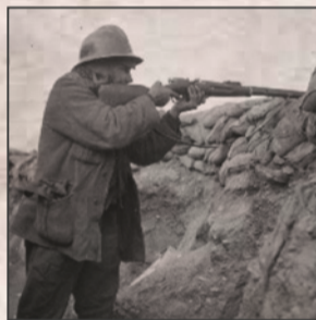
Brigadista en Segura de Baños

Como maniobra de distracción de tropas franquistas, que se preparaban para recuperar la ciudad de Teruel, el mando republicano lanzó un ataque simultáneo y por sorpresa en Segura de Baños, flanco norte de las líneas franquistas, atacando el frente fortificado de la Atalaya y la Sierra Pedregosa para caer por la espalda sobre Vivel del Río Martín. En este ataque intervinieron por primera vez en las Cuencas Mineras las Brigadas Internacionales.