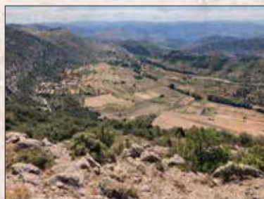
Posiciones en Cirujeda