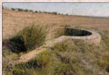
Puesto de artillería antiaérea. Aeródromo de Muniesa

Las fuerzas franquistas trataron de hacerse con el poder en muchos pueblos de las Cuencas Mineras pero se encontraron con un potente núcleo de resistencia en Utrillas, donde los sindicatos obreros de las minas se defendieron de los ataques y extendieron su influencia por los pueblos del valle del Martín.