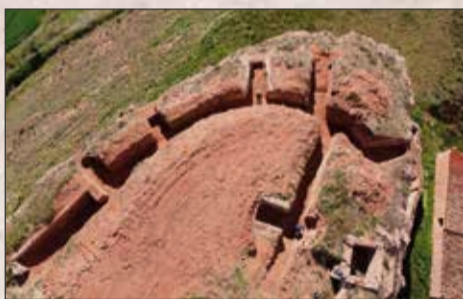
Posición Peña del Cementerio. Vivel del Río Martín