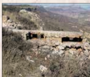
Posición Los Villares. Anadón-Allueva

El 17 de marzo de 1938 finalizó la Ofensiva y la mayor parte de la Comarca, excepto la zona más al sur, quedó en manos de las tropas nacionales.