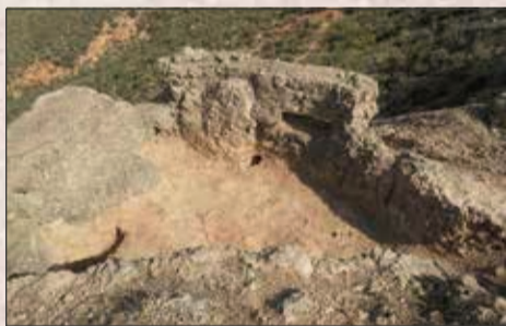
Posición La Matilla . Martín del Río

Desde este momento Vivel se sitúa a la vanguardia del ejército franquista, en la posición más avanzada del "Saliente". Como consecuencia, muchas posiciones hacia Martín del Río se fortifican.