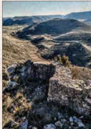
La Rambla de Martín